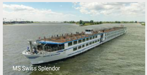
MS Swiss Splendor

Sowohl das Design der 2024 frisch renovierten Swiss Splendor als auch die luxuriöse Ausstattung lassen keine Wünsche offen. Das Foyer mit Rezeption, Bibliothek und Bordboutique, das elegante Restaurant, die stylische Lounge mit Panorama-Bar und Tanzfläche, sowie das Sonnendeck laden zu einem entspannten und unvergesslichen Aufenthalt ein. Die Decks sind durch einen Fahrstuhl verbunden (ausgenommen Sonnendeck). Das Schiff bietet Platz für 174 Gäste in 94 Kabinen. Die Kabinen auf dem Mittel- und Oberdeck verfügen über französische Balkone. Alle Kabinen sind mit Flachbildfernseher, Minibar, Tresor, Haartrockner, Klimaanlage, Telefon, (Regen-)Dusche und WC ausgestattet.