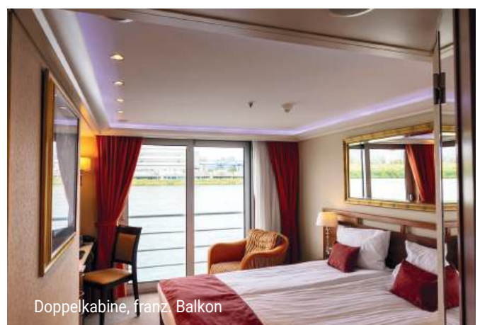
Doppelkabine, franz. Balkon